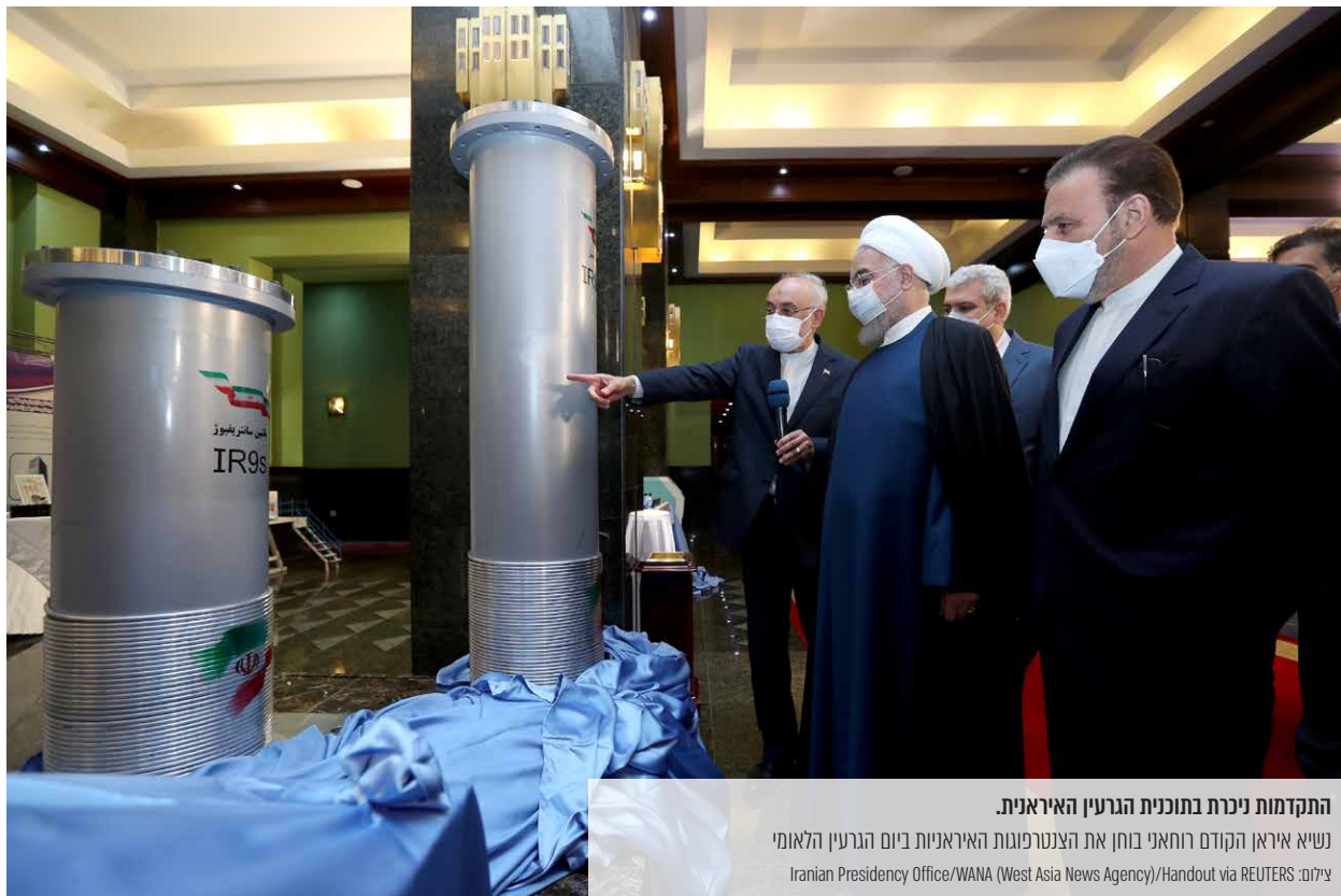
התקדמות ניכרת בתוכנית הגרעין האיראנית. נשיא איראן הקודם רוחאני בוחן את הצנטרפוגות האיראניות ביום הגרעין הלאומי