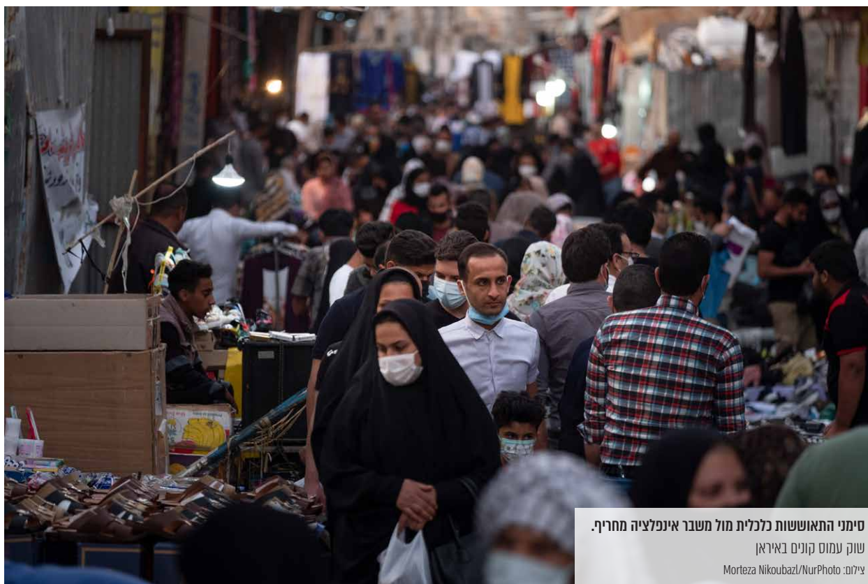
סימני התאוששות כלכלית מול משבר אינפלציה מחריף.

בשנה הקרובה, גם אם יחזרו להסכם הגרעין והסנקציות יוסרו, שיפור כלכלי משמעותי אינו סביר בשל חוסר הוודאות לגבי מדיניות הממשל החדש בווישינגטון, היעדר כוונה מצד רוב החברות האירופיות לשוב ולעשות עסקים עם איראן והבעיות המבניות שמהן סובלת כלכלת איראן (שחיתות, מעורבות משמרות המהפכה בכלכלה וסירוב איראני מתמשך לאשר את תקנות FATF). בתרחיש של המשך הסנקציות והחמרתן צפוי המשבר הכלכלי להחריף, אף כי נראה שיש ביכולתו של המשטר להחזיק מעמד באמצעות עקיפת הסנקציות, הישענות גוברת על סין והמשך התאמת הכלכלה למשטר הסנקציות ("כלכלת התנגדות").